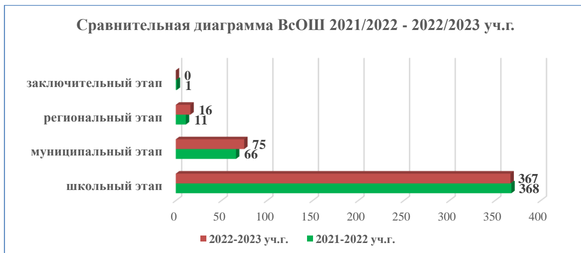
Диаграмма по результатам участия школьников во ВсОШ